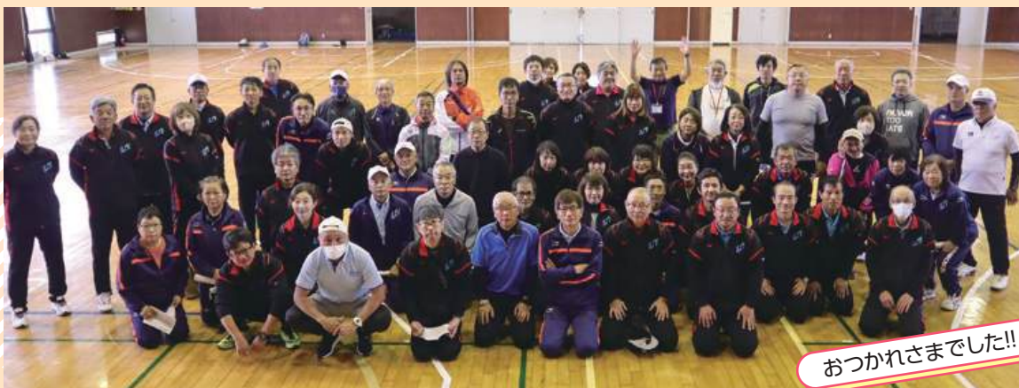
おつかれさまでした!!