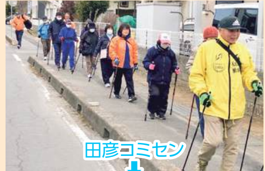
田彦コミセン ↓ 大島公園