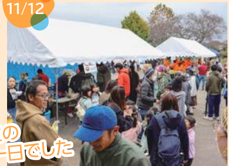
曇り空の寒い一日でした