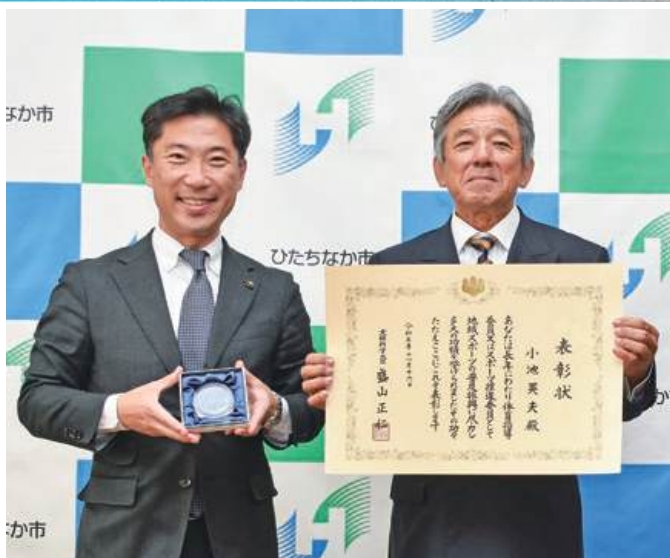
全国スポーツ推進委員 研究協議会青森大会