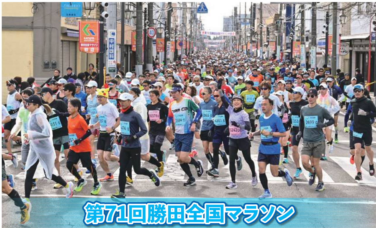
第71回勝田全国マラソン