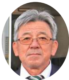
スポーツ推進委員長