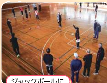
ジャックボールに 近いチームが勝ち