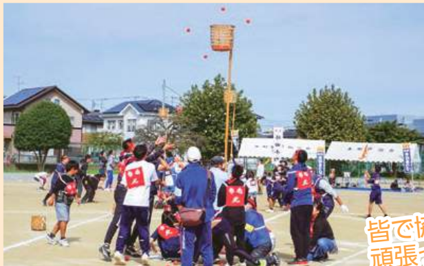
皆で協力して 頑張ってます