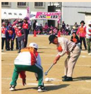
ご先輩方も 楽しく参加して います