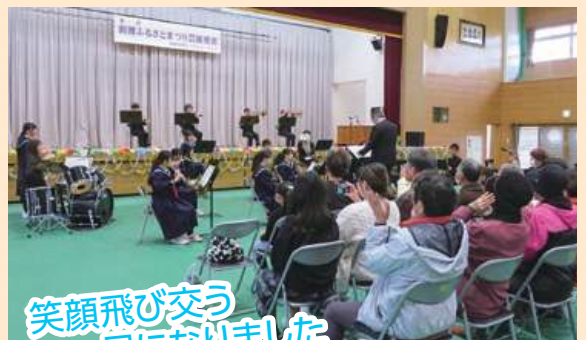
笑顔飛び交う 一日になりました