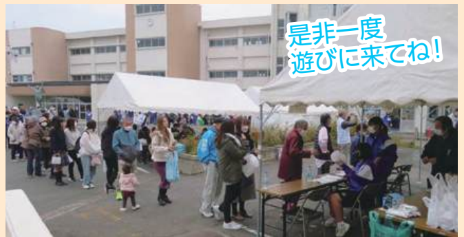
是非一度 遊びに来てね!