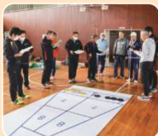
マイナス点に注意して!!