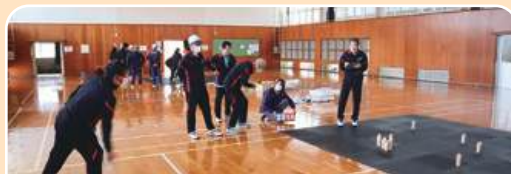
何点に なったかな?