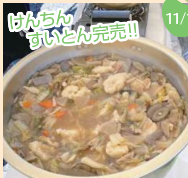
けんちゃん すいとん売売!!