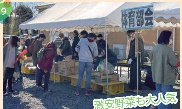
激安野菜も大人気