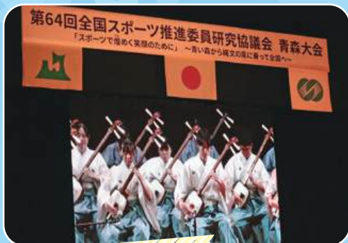
津軽三味線の演奏で 全国大会がはじまりました。