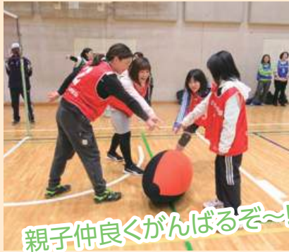
親子仲良くがんばるぞ〜!