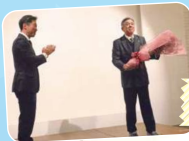
市長より花束 おめでとうございます