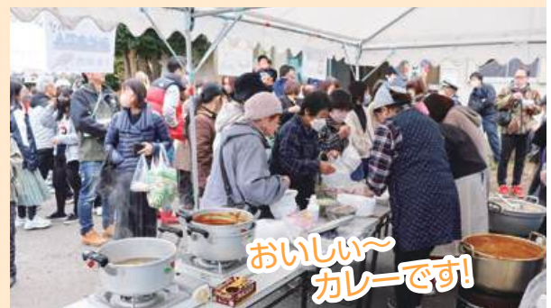
おいしい~カレーです!