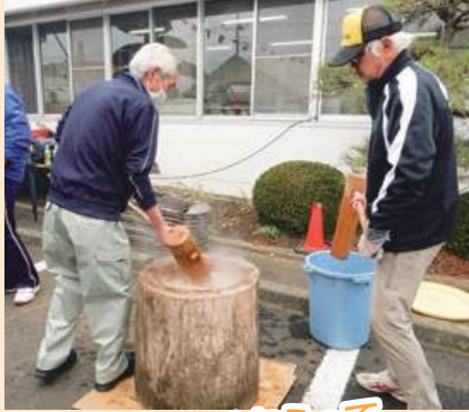
老体にムチをうって餅ついてます(笑)